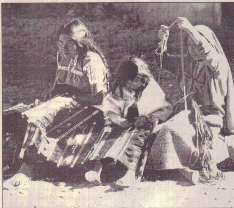
SIN PERDER SU IDENTIDAD.

En esa fragmentación del ser, lo externo nos atrapa y nos transforma en dependientes. La independencia va de la mano con el desarrollo cultural de un pueblo, en su tiempo, en su espacio. De ahí la importancia del trabajador de la cultura, el investigador, el